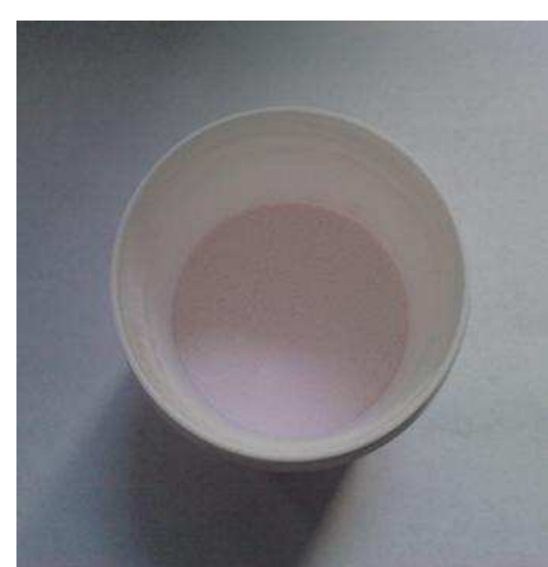
Fig 1 : A gauche, poudre titrée de mélatonine au 1/20

Les objectifs spécifiques du travail comportaient la mise en forme galénique de gélules de mélatonine et la mise au point d'une méthode analytique de dosage du principe actif (PA).