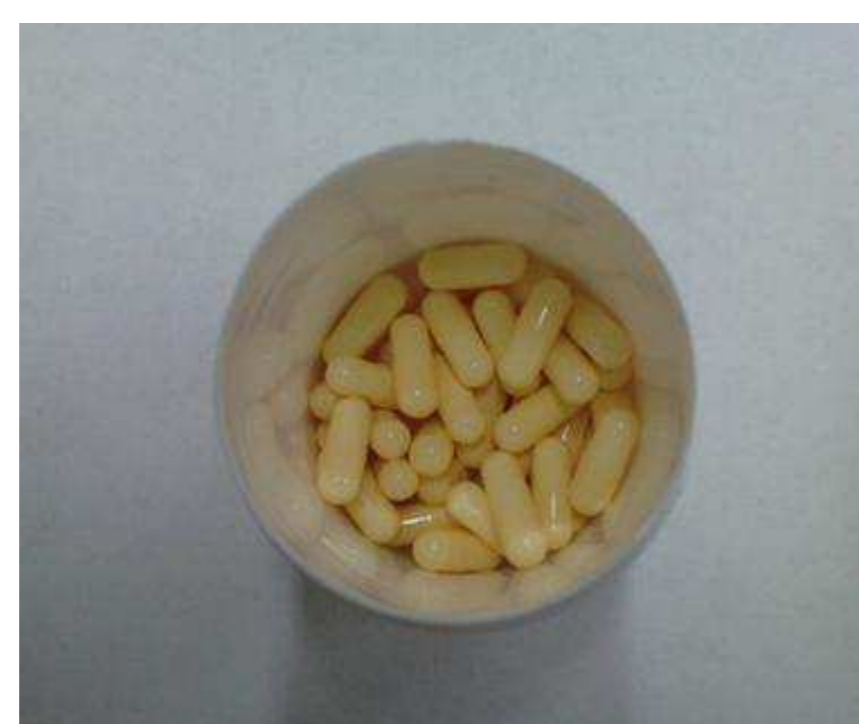
Fig 2 : A droite, 50 gélules n°4 de mélatonine à 0,5 mg